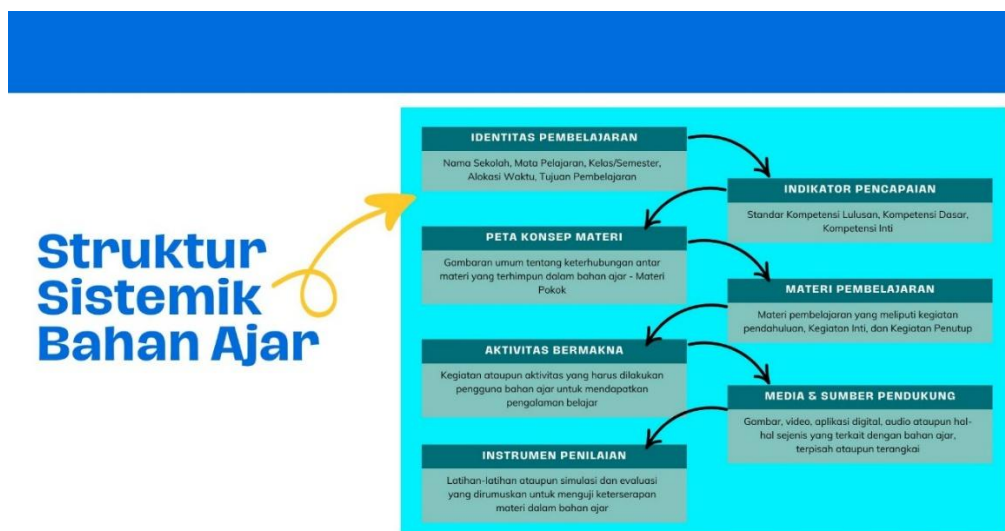
Gambar 2. Struktur Bahan Ajar Berbasis Sistem